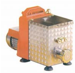
Pastamaskin Modell La Fattorina Pris kr 13. 500,-

Mål B 42 x D 60 x H 125 cm Vekt 85 kg Strøm 230V/50/1-fase