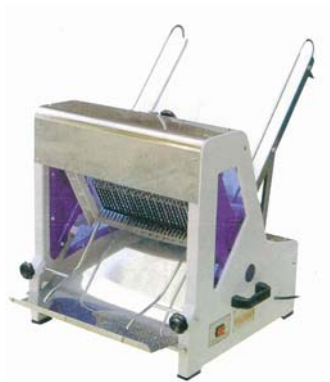
Brødkjærer gravitasjon Modell HL-52006 Pris kr 16. 650,-

Mål B 60 x D 60 x H 63 cm Vekt 80 kg Strøm 230V/50/1-fase effekt 250 W