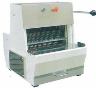
Brødkjærer mini Modell HL-52002 Pris kr 24. 930,-

Mål B 76 x D 72 x H 83 cm Vekt 115 kg Strøm 230V/50/1-fase effekt 370W