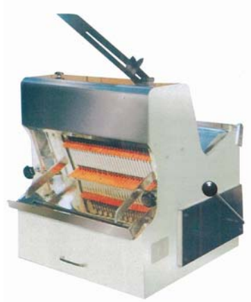
Brødkjærer Modell HL-52001 Pris kr 31. 230,-

Maskiner som skjærer hele brød i en operasjon. Alle typer brød, skjæres hurtig og effektivt med rene snittflater. Alle maskinene er enkle og helt sikre og bruke. Kniver i rustfritt stål.