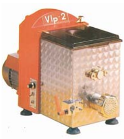
Pastamaskin Modell VIP 2 Pris kr 15. 300,-

Mål B 20 x D 48 x H 29 cm Vekt 20 kg Strøm 230V/50/1-fase