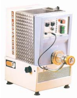
Pastamaskin Modell Compatta/90 Pris kr 53. 100,-

Maskin med kapasitet 8 kg. Produksjon pr. time 25 kg. Kjølesystem Tørkesystem/vifte